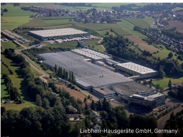
Liebherr-Hausgeräte GmbH, Germany