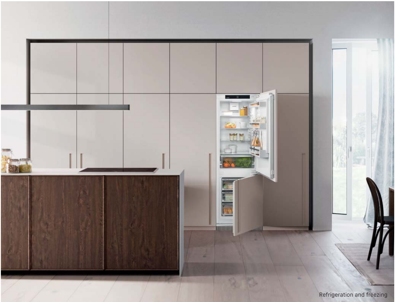
Refrigeration and freezing